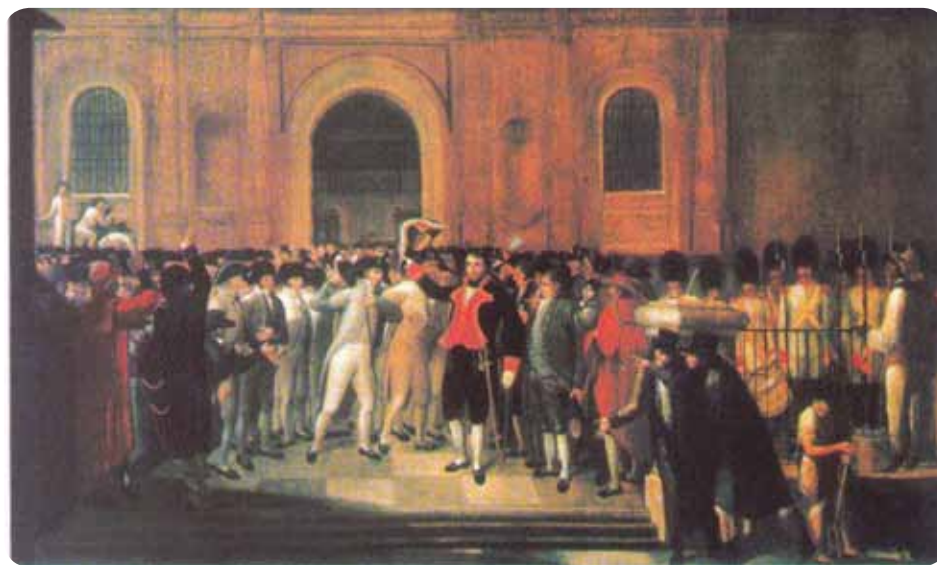
El 19 de abril de 1810 comenzó la gesta independentista venezolana

“...Declaramos solemnemente al mundo que sus provincias unidas son y deben ser desde hoy, de hecho y de derecho, Estados libres, soberanos e independientes y que están absueltos de toda sumisión y dependencia de la Corona de España o de los que se dicen o dijeren sus apoderados o representantes, y que como tal Estado libre e independiente tiene un pleno