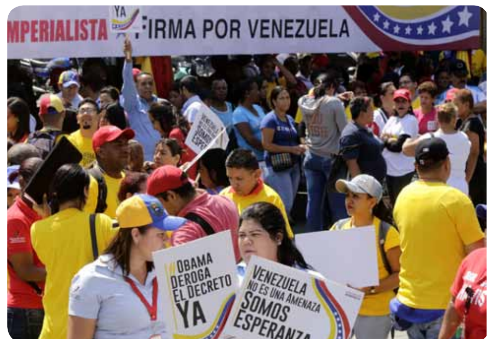
En marzo de 2015 en Venezuela y varios países se recolectaron más de 10 millones de firmas para exigirle al Presidente Obama la derogación del decreto injerencista