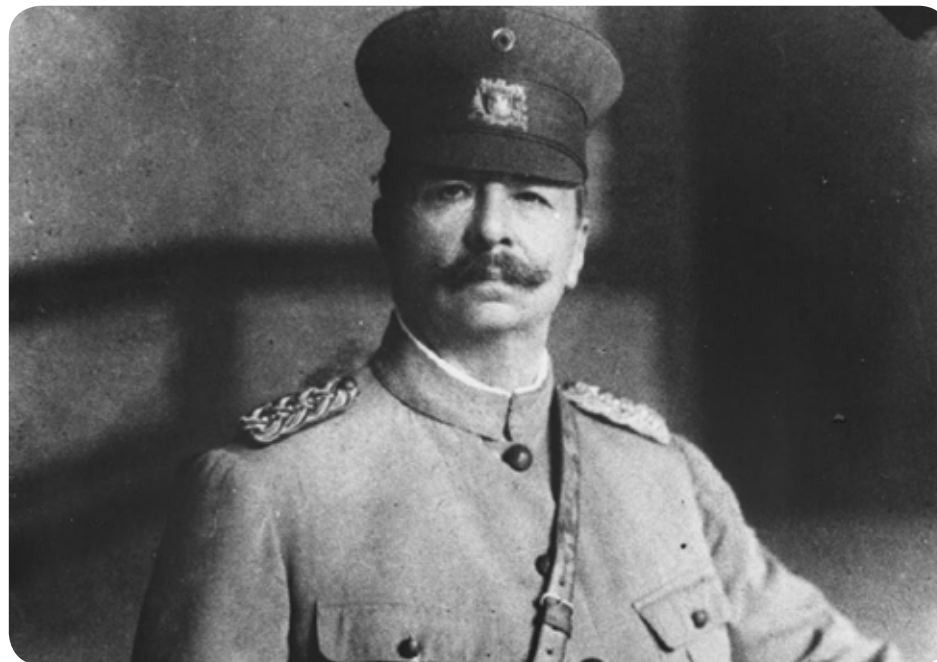
El dictador Juan Vicente Gómez

“La planta insolente del extranjero ha profanado el sagrado suelo de la Patria... El duelo es desigual porque el atentado ha sido consumado por las dos naciones más