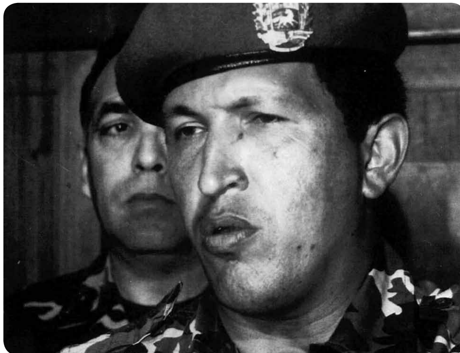
En 1992 surgió públicamente un movimiento político, liderado por Hugo Chávez, que quería cambiar el modelo de gobierno corrupto

A partir del año 2001, el Comandante Supremo Hugo Chávez solicita a la Asamblea Nacional Poderes habilitantes para legislar en diversos órdenes y avanzar en el impulso de las transformaciones necesarias, en aras de lograr en el marco de la